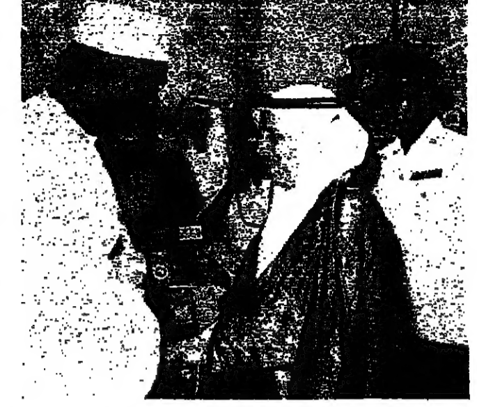
امير الكويت ورئيس ماليزيا

الكويت - من محمد قديري: وتوقع ان تكون المساعدات الائتمانية من ابراهيم الكويت مع رئيس ماليزيا محمد بن حسين في دولة الكويت. وقال امير الكويت امس في بيان صحفي: ان العلاقات الاقتصادية بين الكويت وماليزيا تتطور وتتعمق يوماً بعد يوم. وانه يتوقع ان تكون العلاقات الاقتصادية بين البلدين في المستقبل اكثر اتساعاً وعمقاً.